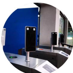
Vstup do školy